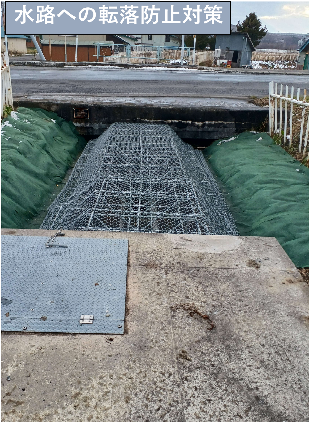
水路への転落防止対策